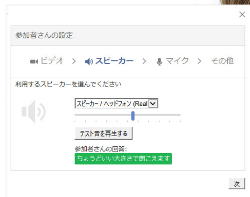
図3 アシスタント画面 主催者側 右は拡大イメージ