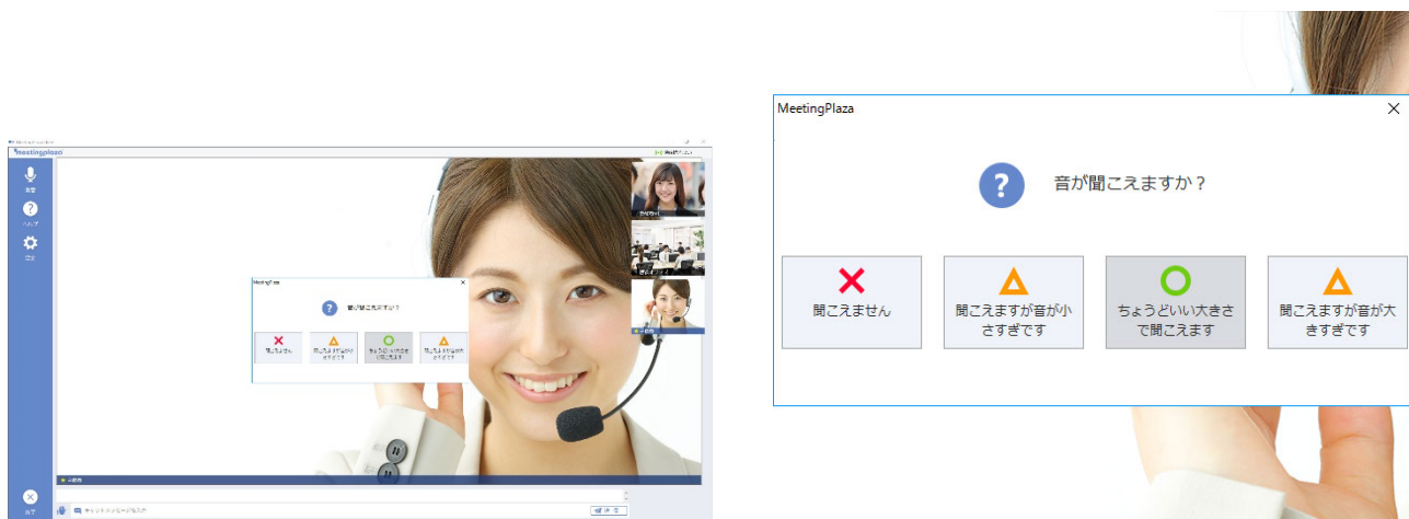
図2 アシスタント画面 参加者側 右は拡大イメージ

音が聞こえない、映像が映らないなど参加者側で発生したトラブルを、主催者がフォローできます。参加者は画面の左側の「ヘルプ」を押し、表示される指示に従って操作するだけで、主催者にトラブル状況を伝えることができます。主催者も画面に表示される指示に従って操作するだけで、参加者側の音声設定、映像設定を遠隔から変更することができます。これにより、参加者に Web 会議の予備知識がない場合でも、円滑に会議を行うことが可能となります。