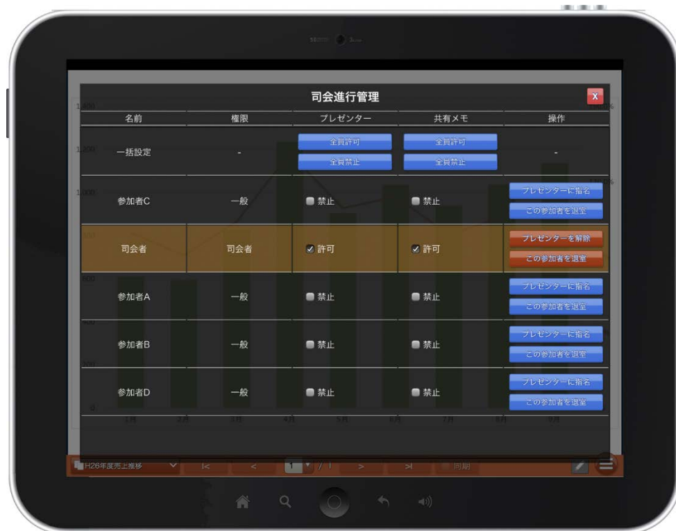
図1 司会進行管理機能 画面イメージ