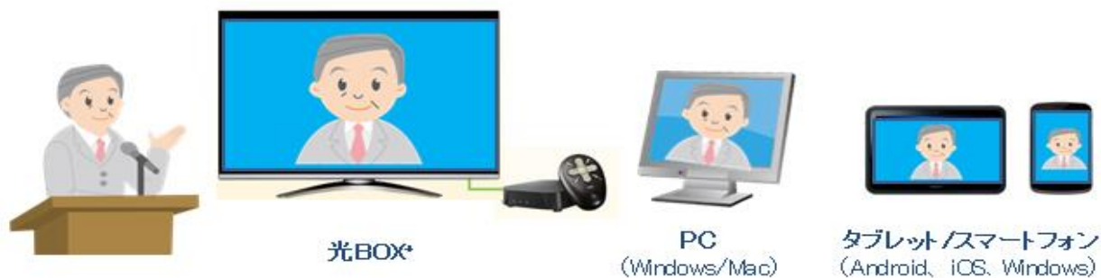
図1 視聴可能な端末