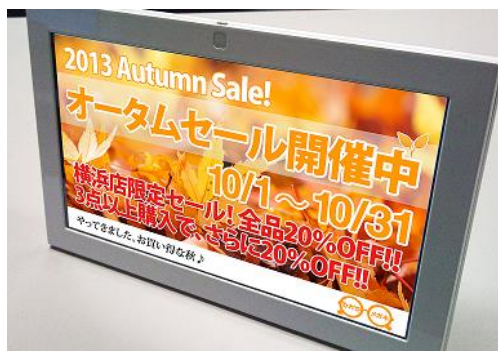
図 2 フォトパネル 05

(参考価格) 100 台ご利用の場合 (税抜価格。別途消費税等を加算いたします)